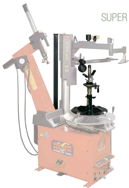
Kit Pax pour SUPER RM NEW (en option) Kit Pax für SUPER RM NEW (optional)